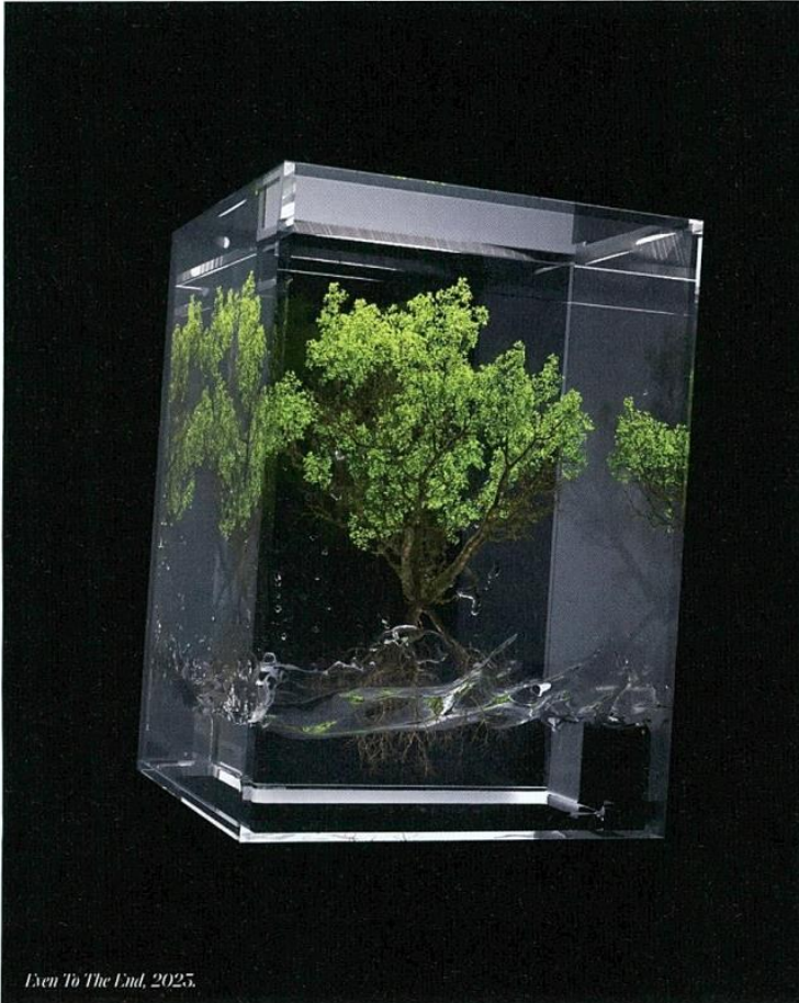
Even To The End, 2025.

Collishaw, Ekim ayında Londra'daki Kew Gardens'da botanik temalı eserlerden oluşan başka bir sergi açacak. Ardından İspanya, İsveç ve İtalya'da birkaç sergisi daha olacak. Ayrıca besteci Gabriel Fauré'nin Requiem isimli eserinin bir orkestra ve koroyla düzenlenen canlı performanslarına eşlik etmek için yaptığı filmin turnesi devam ediyor. Film, önümüzdeki birkaç ay içinde Fransa'nın Rouen kentinde ve Londra'daki Barbican Centre'da gösterilecek. ♡